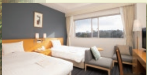
パークビューツイン