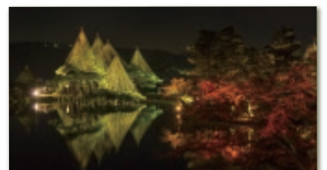
eat. 金沢城・兼六園四季物語 (ライトアップ)